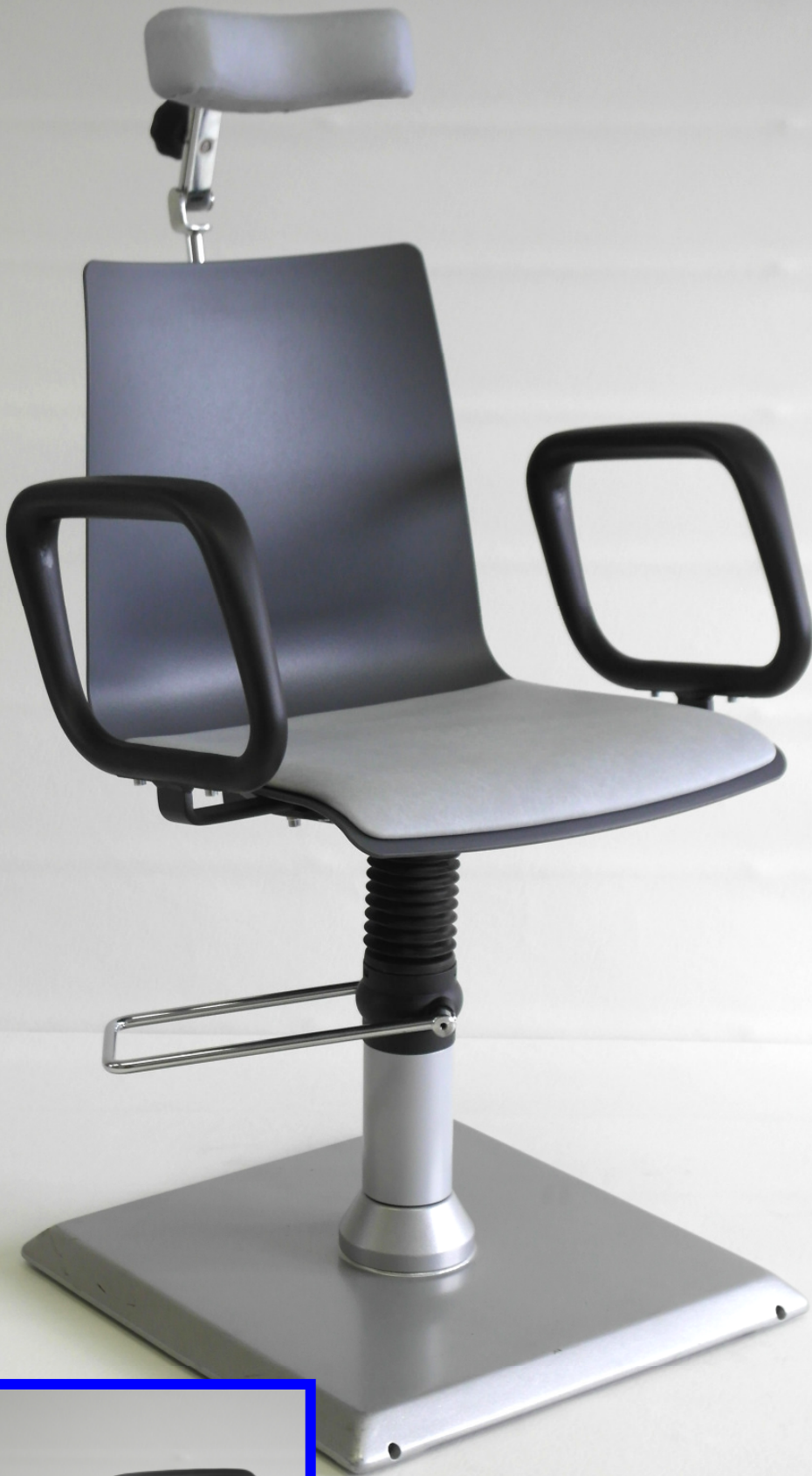
Abb. 4045 U mit Ringarmlehnen, Polstereinlage und Schalenkopfstütze