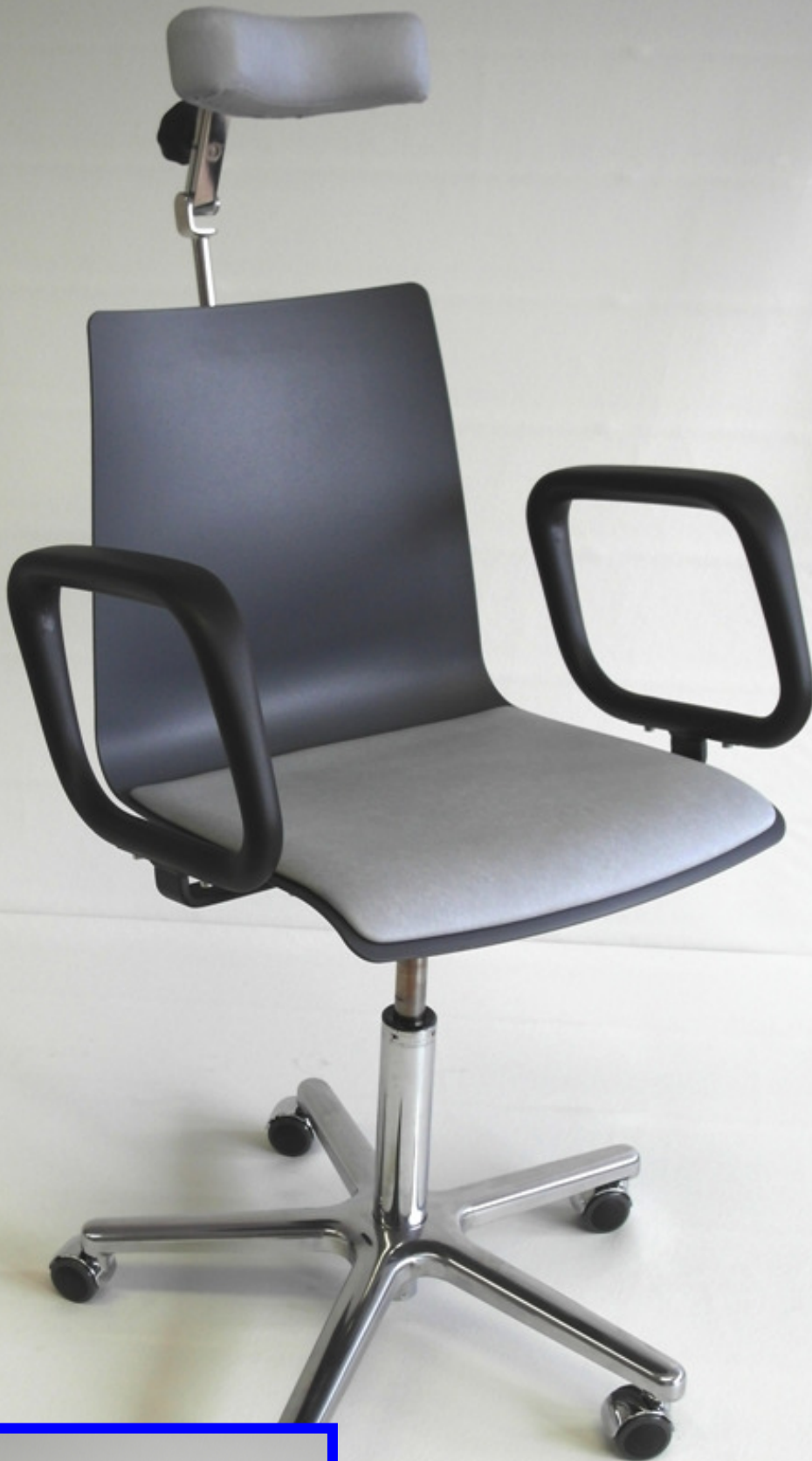
Abb. 4047 U mit Ringarmlehnen, Polstereinlage und Schalenkopfstütze