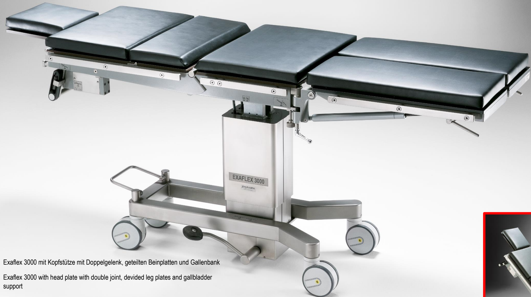
Exaflex 3000 mit Kopfstütze mit Doppelgelenk, geteilten Beinplatten und Gallenbank